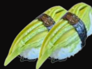
Avocado N7. Abo 5,90