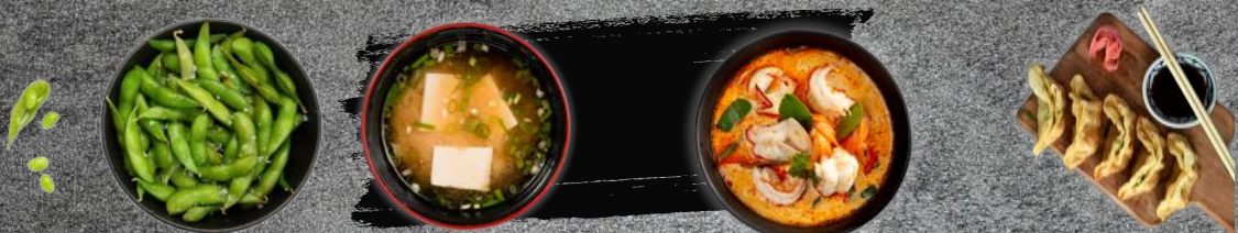
Die Abbildungen dienen nur zu dekorativen und symbolischen Zwecken. Keine Originalbilder der Gerichte.

Eine Variation aus unseren Vorspeisen, Sommerrollen, Frühlingsrollen, Ebi Tempura, Edamame, Süß-Kartoffel-Sticks a, b, c, e, f