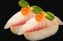
Tilapia N4. Tai d 5,50