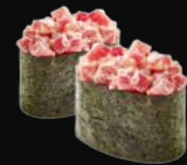
Würziger Thunfisch, Lauch mit Spicy sauce N9. Maguro Gunkan d 6,50