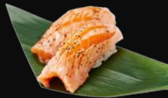
Feuerlachs, Aal N6. Aburi Sake Nigiri d 6,50